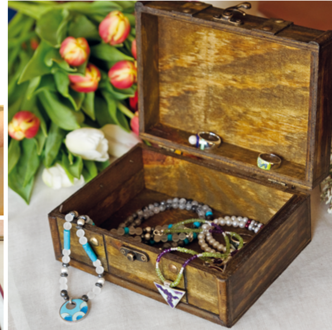
Besondere Lieblings-Schätze behält die Künstlerin für Familie und Freunde.